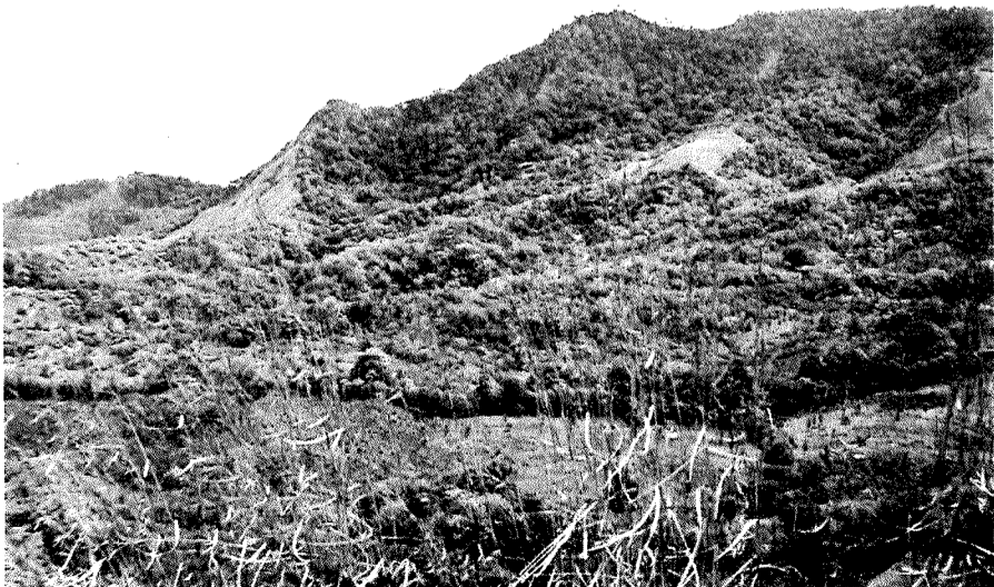
Ká bata i' kì Kuàsula sérkë

Ies se' iyi wámbale sènoie bua' ére ká dör salú.